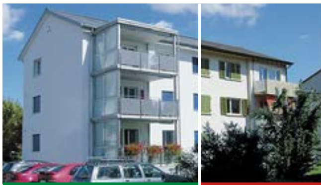
Eine gute Planung ermöglicht effektive und finanziell sinnvolle Gebäudemodernisierungen. Links modernisiertes Gebäude, rechts vor der Modernisierung.